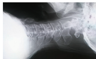
▲ストレスがかかり不自然な状態