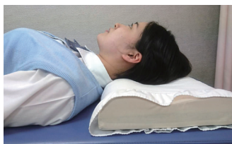
▲プラウド・ピロー使用時