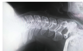
▲神経が圧迫されません。